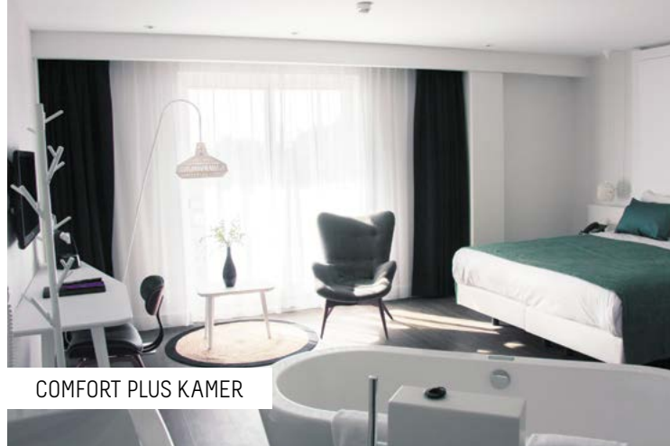
COMFORT PLUS KAMER